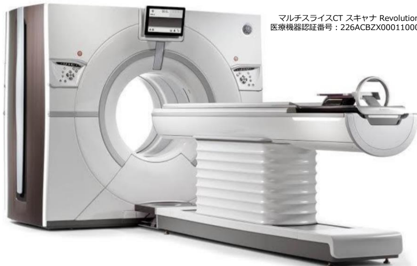
マルチスライスCT スキャナ Revolution 医療機器認証番号：226ACBZX00011000

当院では2019年4月より、最新鋭256列マルチスライスCTの運用を開始いたします。右記の利点から、患者様の負担は大幅に軽減。また、 不整脈 や 高心拍 、 息止め不可 などのCT撮影困難な患者様への検査が可能となります。